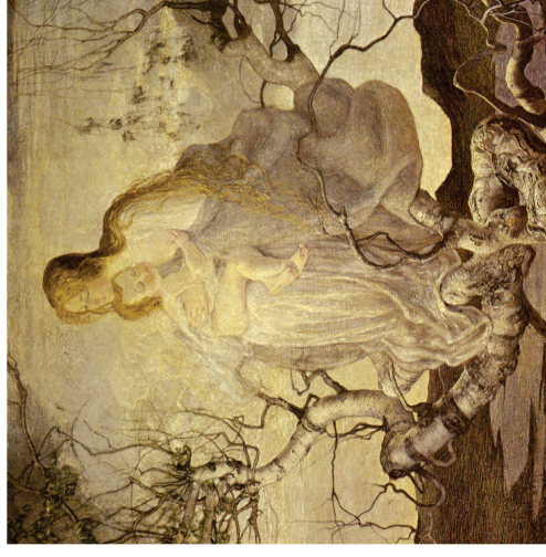
L'angelo della vita di Giovanni Segantini

AULA SAN GIORGIO - PARROCCHIA DI SAN GIORGIO MILANO PIAZZA SAN GIORGIO, 2